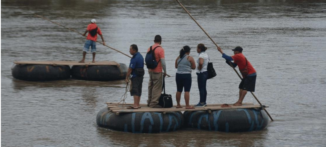
Un grupo de personas atraviesa en balsa el río Suchiate, cruzando la frontera entre Guatemala y México.

15 de abril. Más de 140.000 personas solicitaron asilo en México durante 2023 , posicionando al país entre los cinco con mayor número de solicitudes a nivel global. Este aumento refleja la creciente necesidad de protección internacional en la región. México también recibió a cientos de miles de personas en tránsito hacia el norte y experimentó un incremento en el desplazamiento interno en siete estados. Las principales razones para huir de sus países de origen fueron la violencia, la inseguridad y las amenazas. Más del 60% de los solicitantes de asilo indicaron que su vida, seguridad o libertad estarían en peligro si fueran devueltos a sus lugares de origen. La Comisión Mexicana de Ayuda a Refugiados (COMAR) , con el apoyo del ACNUR, ha cuadruplicado su capacidad de atención desde 2018 y logrado aumentar la tasa de reconocimiento de la condición de refugiado. Sin embargo, persisten desafíos para consolidar la estructura y capacidad operativa de la COMAR , así como para asegurar un presupuesto adecuado para atender a las personas con necesidades de protección internacional.